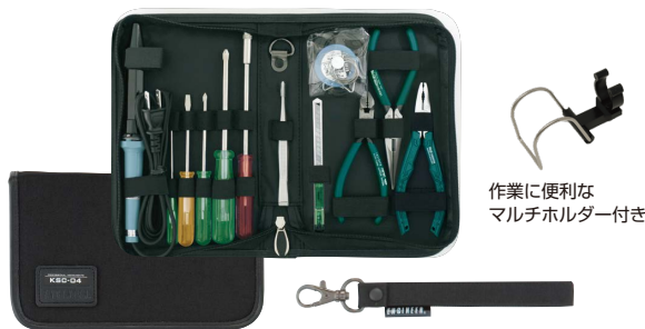
作業に便利なマルチホルダー付き

ケースのみ KSE-04 ¥3,124(2,840) (梱包数(ヶ):1、JANコード:70540)