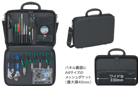
パネル裏面にA4サイズのメッシュポケット(最大厚40mm)